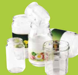
Pots & bocaux en verre