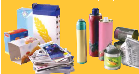
Papiers & emballages