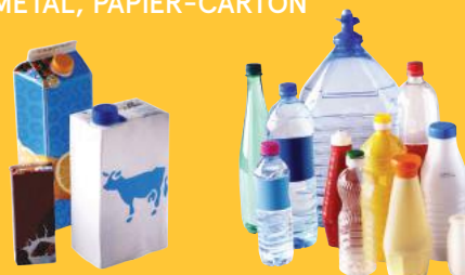
Briques en carton

EMBALLAGES EN PLASTIQUE, MÉTAL, PAPIER-CARTON